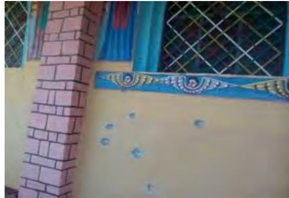
1 ቅዱስ ሚካኤል ቤተ ክርስቲያን

ጎዳር 19 ቀን 2013 ዓ.ም. በአክሱም ከተማ የደረሰውን ጉዳት በተመለከተ ነዋሪዎች ለኮሚሽኑ ሲያስረዱ የኢትዮጵያ መከላከያ ሰራዊት አባሎችና ኃላፊዎች በከተማው ውስጥ እያሉ ጥቃቱን ባለመከላከላቸው ጉዳቱን የከፋ አድርጎታል በማለት ገልጸዋል። በሌላ በኩል ከዚህ ክስተት በኋላ ታኅሳስ 14 ቀን 2013 ዓ.ም. የኤርትራ ወታደሮች ወደ አክሱም ቅድስት ማርያም ፅዮን ቤተ ክርስቲያን ገብተው ለመዝረፍ ያደረጉትን ሙከራ የመከላከያ ሠራዊት አባላትና ህዝቡ ተባብሮ እንደተከላከለው ምስክርነታቸው የሰጡ ነዋሪዎች እና የቤተ ክርስቲያን አገልጋዮች አሉ።