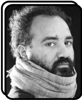
ገጣሚ ኤፍሬም ስዩም