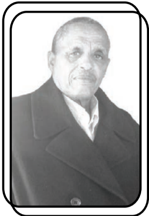
አስገደ ገ/ሰላሴ ከ መቀሌ

ከግንቦት 20 መከበር ጋር ተያይዞ በአሉ ያመጣውን ውጤት ከማየታችን በፊት ወደ ኃላ ተመልሰን መመልከቱ ለማወቅ ጠቃሚ ይሆናል።