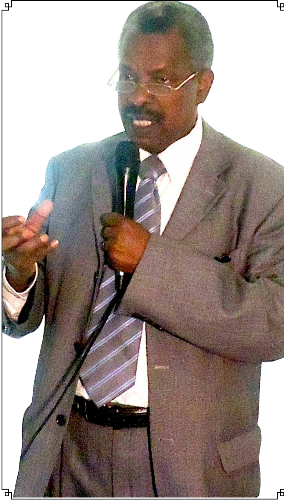
ምንድነው? የብሔራዊ ም/ቤት አባልና የአንድነት ፓርቲ የፖለቲካ ጉዳይ ምክትል ኃላፊ ነኝ።

➤ የፖለቲካ ጉዳይ በፓርቲው ውስጥ በዋነኝነት ሥራው ምንድነው? የሀገሪቱን የፖለቲካ እንቅስቃሴ በመቃኘት