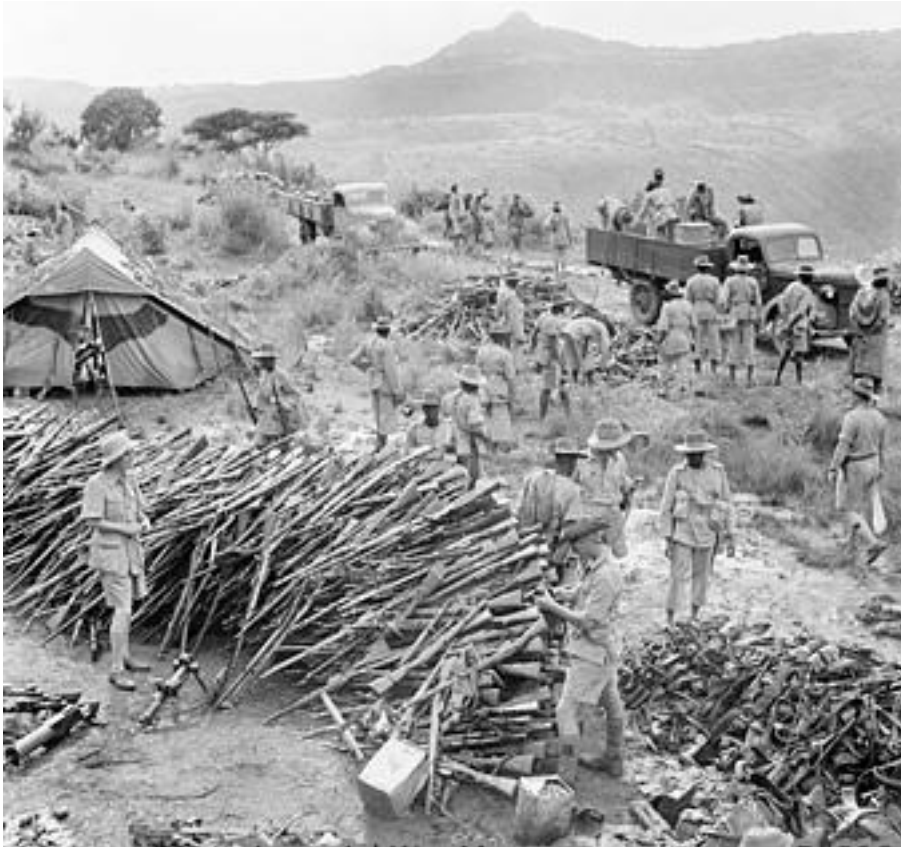
ጎንደር የተማረኩ የፋሽስት ኢጣሊያ ወታደሮች ጠመንጃ ክምር

ከዚህ በኋላ ሰራዊቱ እንዲረጋጋ የተማረኩና የተበተኑት የጠላት ወታደሮችም እንዲሰበሰቡ በተማረኩ የጠላት ወታደሮች ላይም አርበኞች ምንም ጉዳት እንዳያደርሱ የማረኳቸውን እንዲያስረክቡ የሚል ትዕዛዝ በመተላለፉ አርበኞች የማረኳቸውን የጠላት ወታደሮች እያመጡ ያስረክቡ ጀመር።